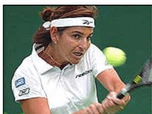
Arantxa Sánchez Vicario

Des joueurs tels que Arantxa Sánchez Vicario ou Conxita Martínez , ou encore Emilio Sanchez Vicario , Carles Moyà , Àlex Corretja , Sergi Bruguera , Albert Costa et Rafa Nadal c'est à dire les plus célèbres, font partie de l'élite mondiale du tennis (à eux six, ils cumulent 9 titres du Grand Slam).