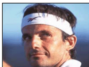
Emilio Sánchez Vicario