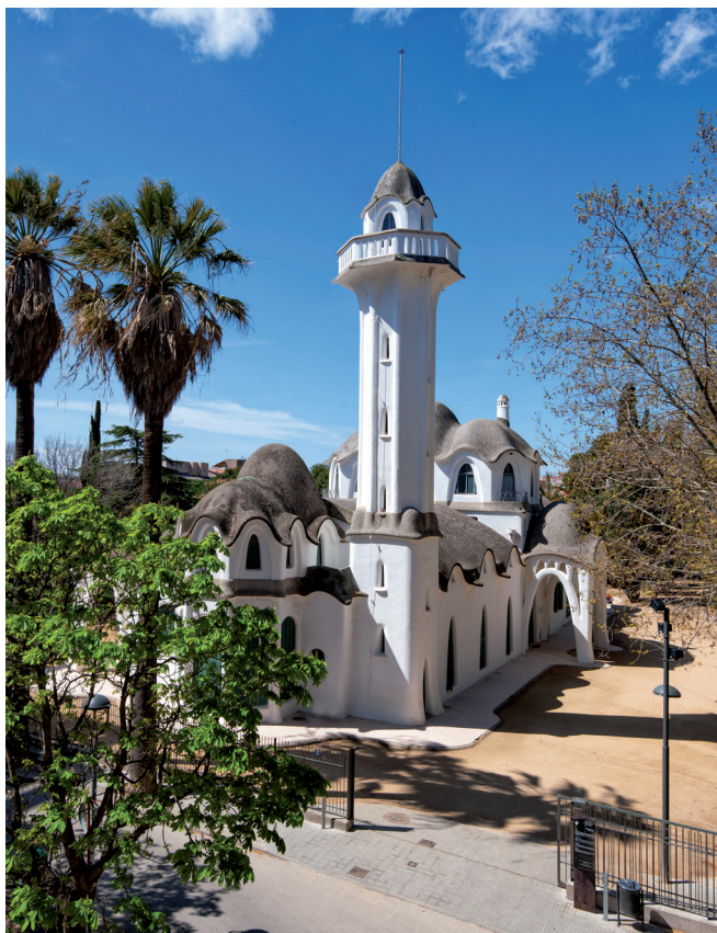
Masia Freixa. Terrassa. Gonzalo Sanguinetti. Diputació de Barcelona.

***Àmbits territorials on es desenvolupa el programa SICTED. / Ámbitos territoriales donde se desarrolla el programa SICTED. / Regions where the SICTED programme is in operation.