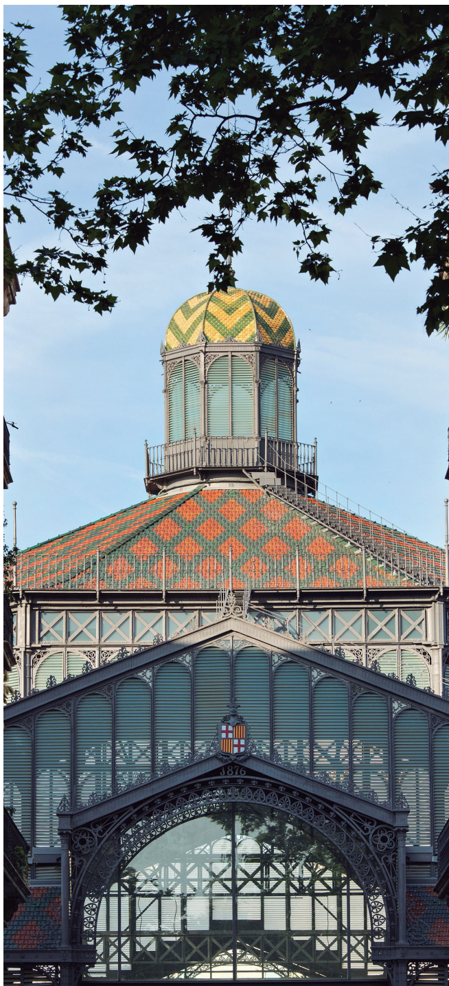
Centre Cultural el Born.