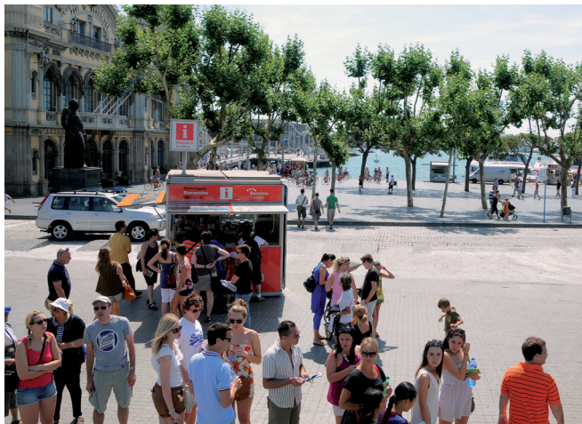
Cabina d'Informació Turística de La Rambla.