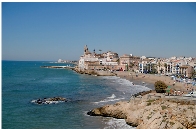
Vil·la de Sitges. Gonzalo Sanguinetti. Diputació de Barcelona.

Nota: dades de la província sense el Barcelonès / Nota: datos de la provincia sin el Barcelonés / Note: data for the province of Barcelona excluding Barcelonés region.