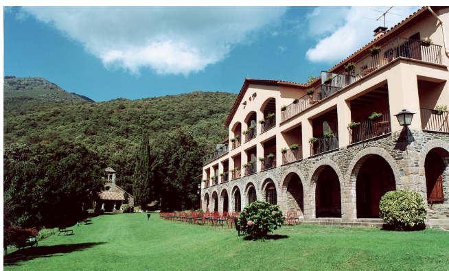
Allotjament hotelier al Parc Natural del Montseny. Hotel Sant Bernat.

1 Inclouen les pensions / Incluyen las pensiones / Boarding houses included.