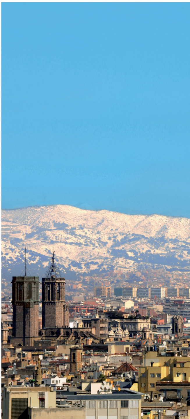
Barcelona i neu.