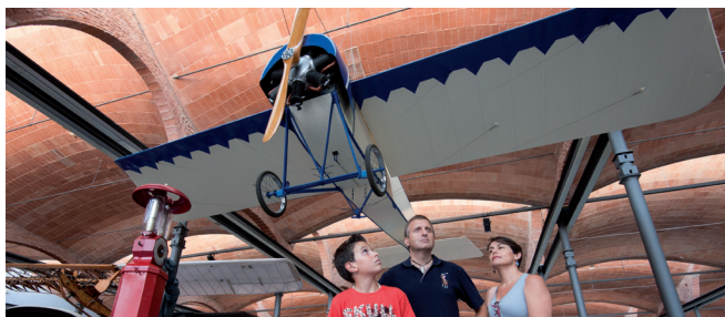
Museu de la Ciència i la Tècnica de Terrassa. Gonzalo Sanguinetti. Diputació de Barcelona.

Nota: dades de la província sense el Barcelonès. / Nota: datos de la provincia sin el Barcelonés. / Note: data for the province of Barcelona excluding Barcelonès region.