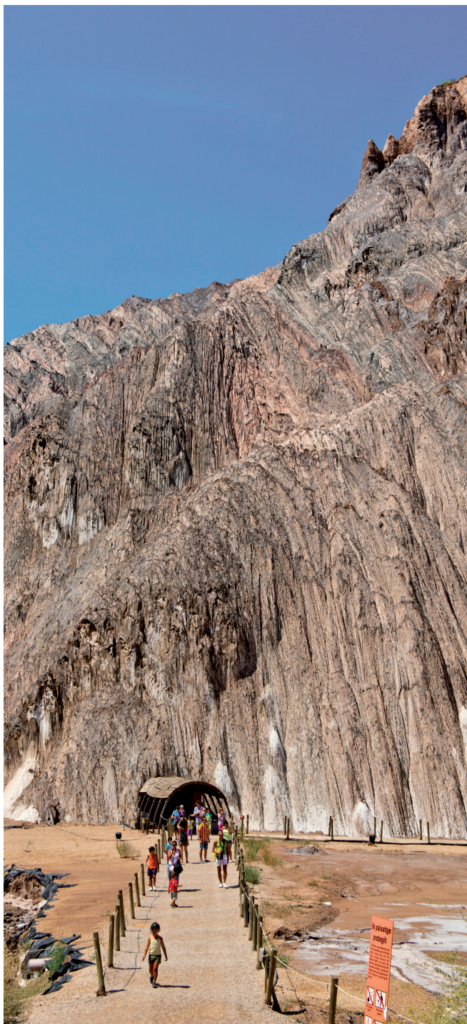
Parc Cultural de la Muntanya de Sal de Cardona. Óscar Rodbag. Fundació Cardona Històrica.