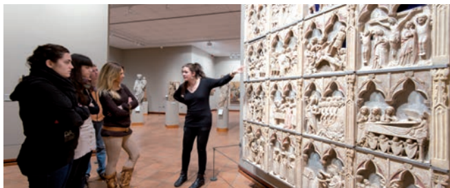
Museu Episcopal, Vic (Osona)

Note: data for the province of Barcelona excluding Barcelonés region.