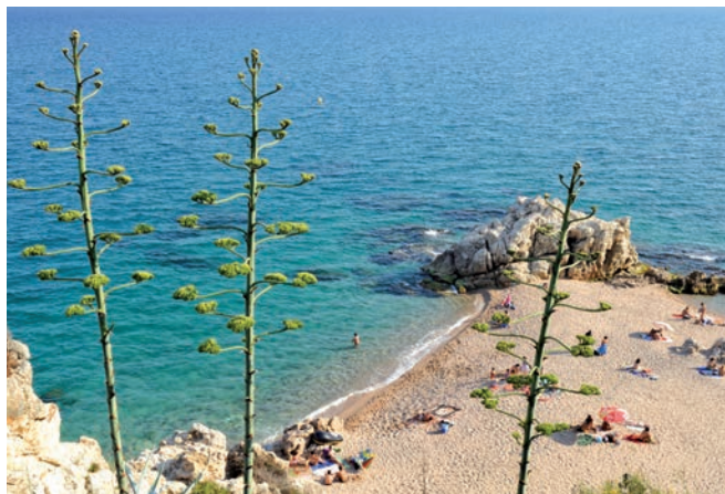
Platja de les Roques. Roca Grossa. Calella (Maresme)

Note: data for the province of Barcelona excluding Barcelonès region.