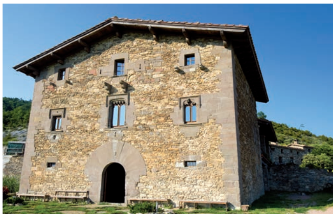
Casa de Turisme rural (Osona)

1. Inclouen les pensions / Incluyen las pensiones / Boarding houses included.