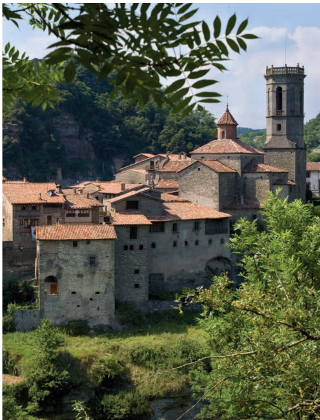
Vista panoràmica, Rupit (Osona)

Regions where the SICTED programme is in operation.