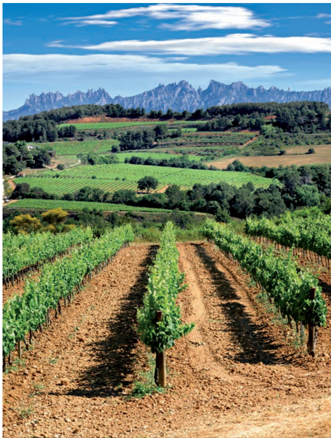
Vinyes al Penedès.

* Inclou les seves capitals / Incluye las capitales / Including the capitals.