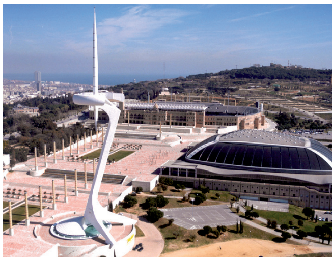
Anella Olímpica. El 2012 es va celebrar el 20è aniversari dels Jocs Olímpics Barcelona'92.