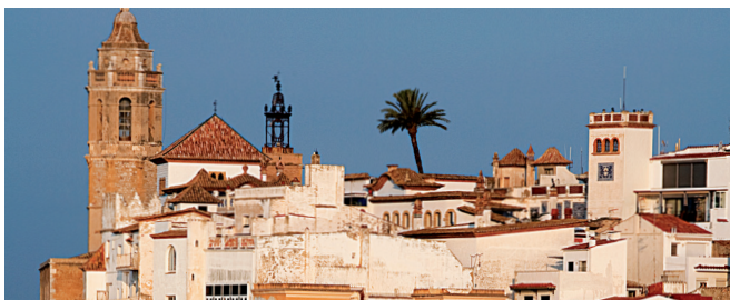
Casc Antic de Sitges (Garraf)