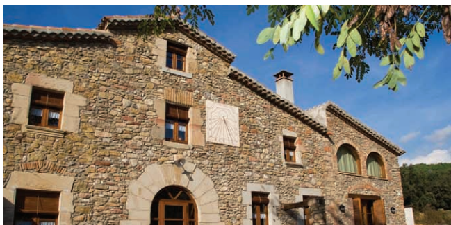
Casa de Turisme Rural (Vallès Oriental)

1. Inclouen les pensions / incluyen las pensiones / boarding houses included.