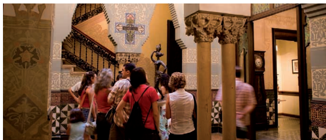
Casa Coll i Regàs, Mataró (Maresme)

Note: data for the province of Barcelona excluding Barcelonès region.