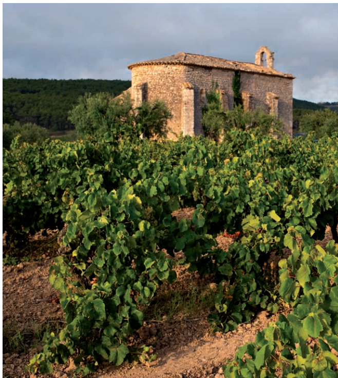
Ermita de Sant Joan del Lledó, Sant Martí Sarroca (Alt Penedès)

* Incloent les seves capitals / Incluye las capitales / Including the capitals.