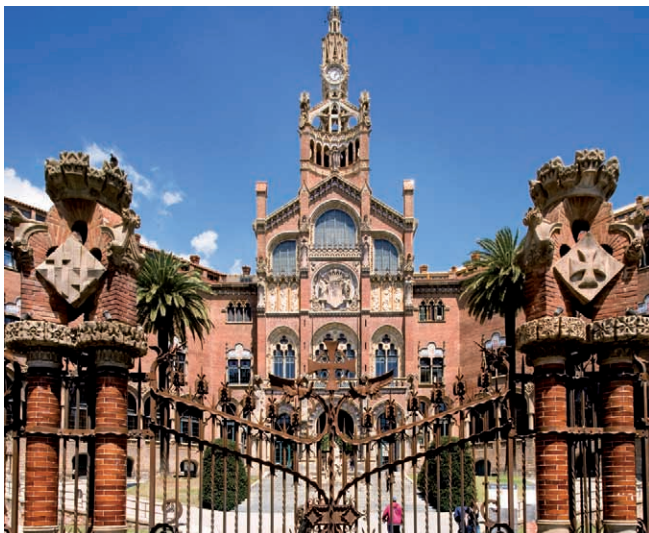
Hospital de Sant Pau