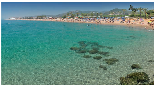
Platja de les Dunes de Santa Susanna (Maresme)

Note: data for the province of Barcelona excluding Barcelonès region.