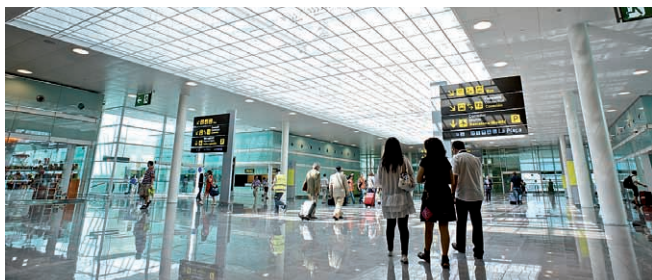
Aeroport de Barcelona

Grimaldi i GNV: Civitavecchia, Porto Torres, Livorno i Gènova; Tangermed.