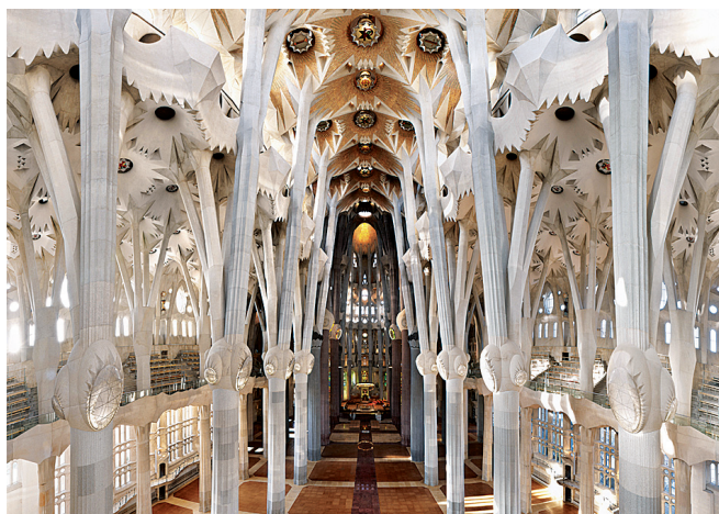
Nau central de la Sagrada Família