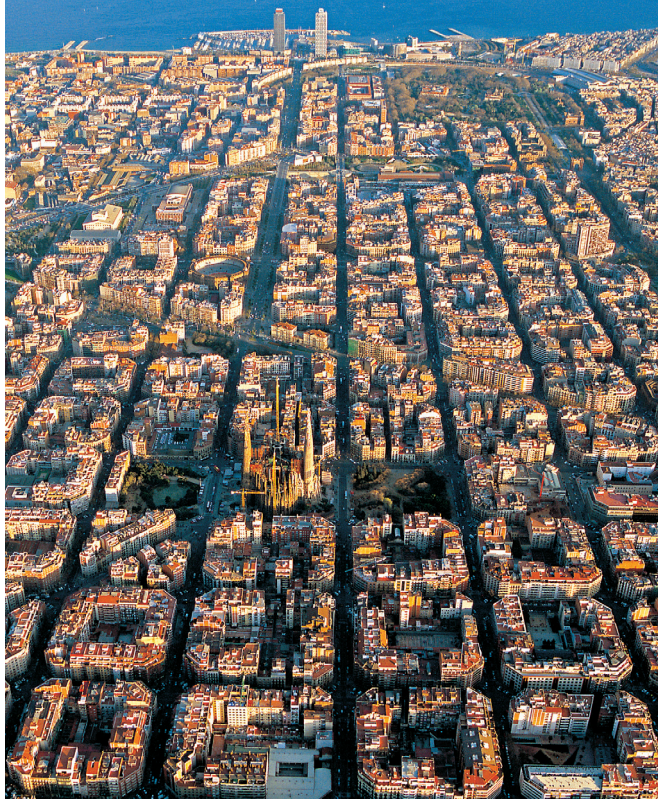
Panoràmica de l'Eixample

This statistical report produced by Turisme de Barcelona contains the most important statistical data relating to tourism in the city of Barcelona. Further information: www.barcelonaturisme.cat/statistics