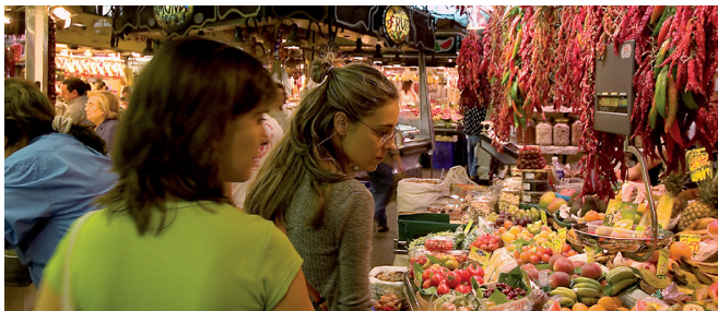
Mercat de la Boqueria