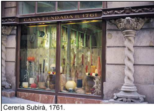
Cereria Subirà, 1761.

Barcelona és una ciutat moderna, on es pot trobar l'últim crit en tecnologia i moda. Però és també una referència tradicional a Europa, amb més de 2.000 anys d'història. Els seus carrers són el testimoni dels vaivens de la humanitat, dels avenços del progrés. El seu comerç, el variat i complementari reflex d'una urbs cosmopolita i a l'avantguarda i d'un llegat, d'una riquesa històrica que li confereix la seva personalitat especial.